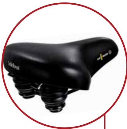
Comfortabel Selle Royal zadel

Comfortabele geometrie, stabiel stuurgedrag en gemakkelijk op- en afstappen. Lekker 'lui' fietsen en zeer geschikt voor de montage van een kinderzitje door de ruime instap.