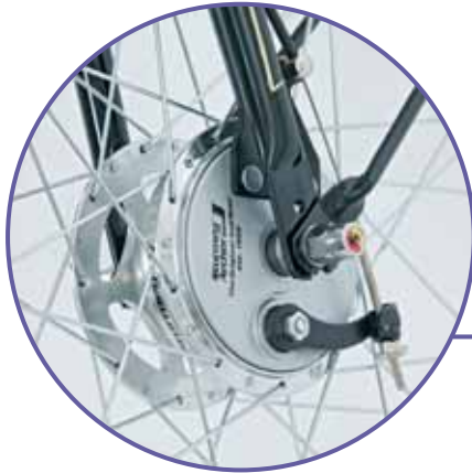
Sturmey Archer XLFD naaf

Het lijkt een antieke fiets maar schijn bedriegt. Het is een super modern stalen ros! Een chroomlook koplamp die werkt op batterijen, lederen handvaten, luxe lederen zadel, een prachtige authentieke ding-dong bel, 3 versnellingen van Sturmey Archer, handgezette biezen en natuurlijk uitgevoerd met een chique kettingkast en lakdoek jasbeschermers.