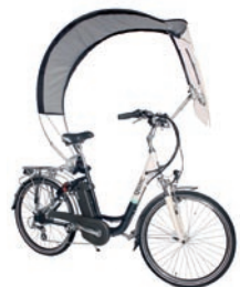
Veltop Eén maat, door universele klemmen past de Veltop op iedere fiets Prijs € 289,-