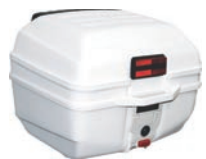
Opbergbox Kleuren Wit / Zwart Prijs voor Emoto 87 € 119,- Prijs voor 80duo € 69,-