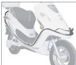
Beschermbeugel Enkel E80duo € 99,-