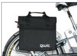
Fietstas Prijs € 19,95,-