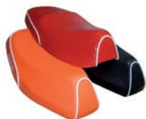
Custom zadels Prijs v.a € 299,- (prijs op aanvraag)