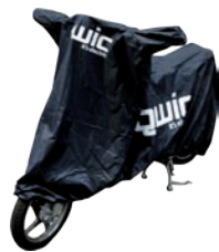
Scooter beschermhoes Geschikt voor alle modellen Prijs € 69,-