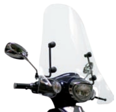
Windscherm Basic Emoto 87 en 80duo € 79,- Full-size Emoto 87 € 139,-